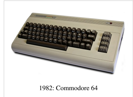
1982: Commodore 64

Dándose cuenta que el PET no podría competir fácilmente con las máquinas de color como Apple II y Atari, Commodore introdujo el VIC-20 para dirigirse al mercado casero. Las limitaciones debido a una minúscula memoria de 4 KB y a su exhibición relativamente limitada en comparación a otras máquinas fueron compensadas por un precio bajo y siempre cayendo. Millones de VIC-20 fueron vendidos.